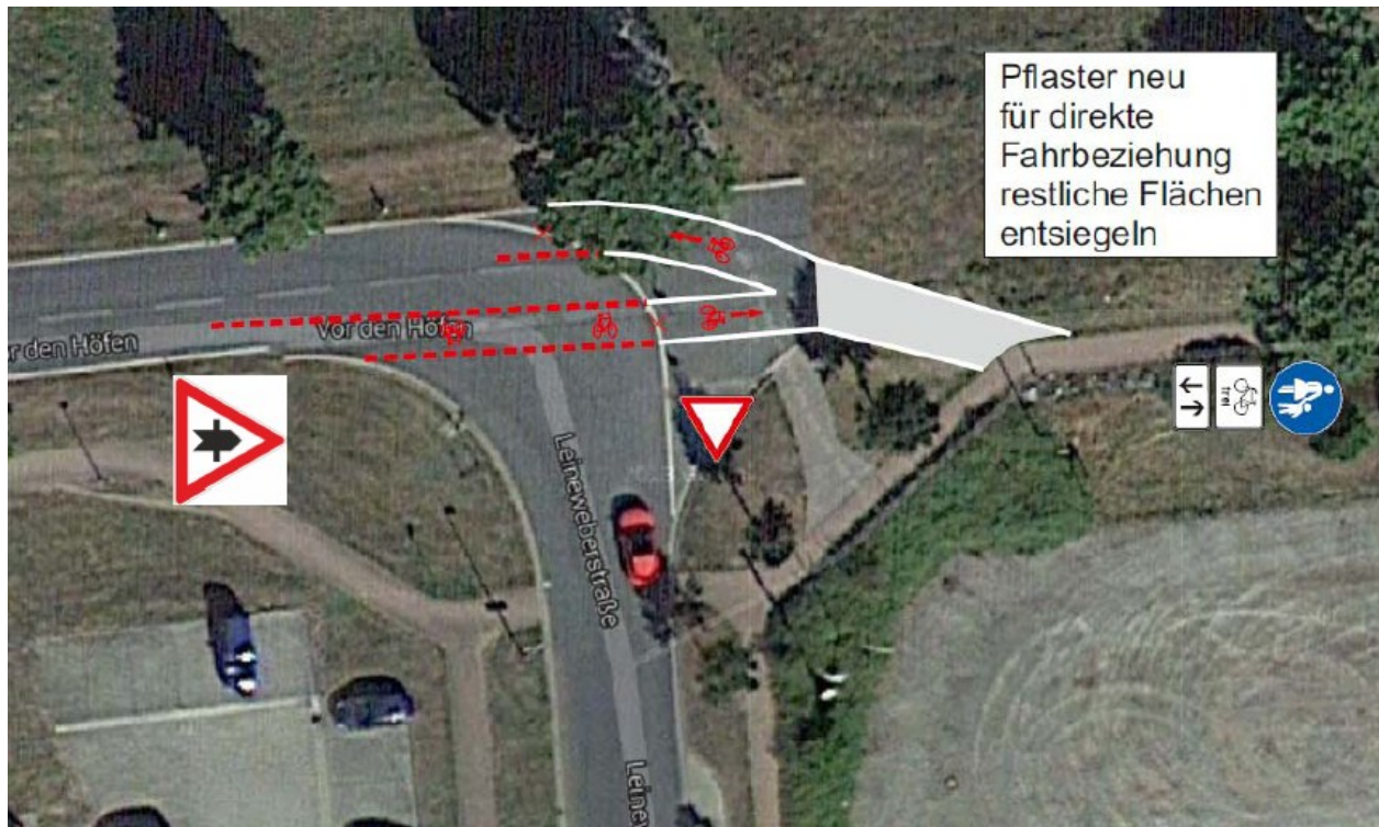
Abb. 1: Kreuzung Vor den Höfen und Leineweberstraße

Die Radwegebenutzungspflicht für den Gehweg Vor den Höfen wurde bereits aufgehoben. Die Radfahrer fahren auf der Straße und bekommen zukünftig eindeutig Vorfahrt im Knotenpunkt. Das wird durch die Beschilderung verdeutlicht und durch die Markierung der Radwegefurt in der Leineweberstraße zusätzlich hervorgehoben. Darüber hinaus wird ein zusätzliches Stück Radweg gepflastert, um die Fahrbeziehung für Radfahrer komfortabler zu gestalten.